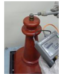
通常の絶縁抵抗測定イメージ

電力の安定供給を維持するため、定期的に電気設備の絶縁抵抗を測定することが義務付けられています。通常この測定では停電が必要なため、スケジュール策定で大きな制約を受けます。これに対し絶縁抵抗が低下すると、部分放電の一種である沿面放電が発生することが知られています。本研究では沿面放電の電流や、金属筐体に誘起する過渡接地電圧の信号を測定し、充電部に対し非接触・無停電で絶縁抵抗値を推定する方法の開発を目指しています。