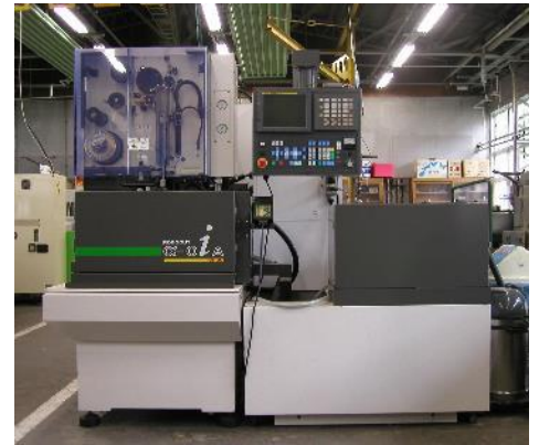
ワイヤカット放電加工機