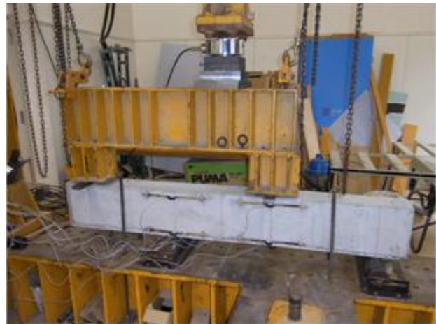
写真 2 試験時の様子