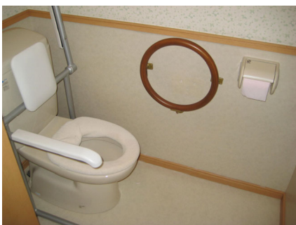
図1 トイレ用円形手すり