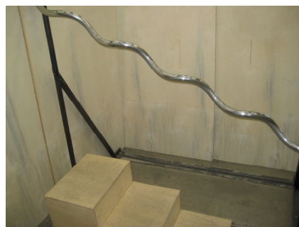
図2 らせん形手すり