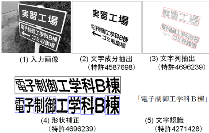
図1 情景中の文字の抽出・認識