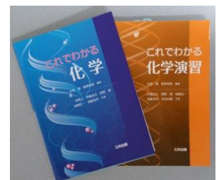
図2 これでわかるシリーズ