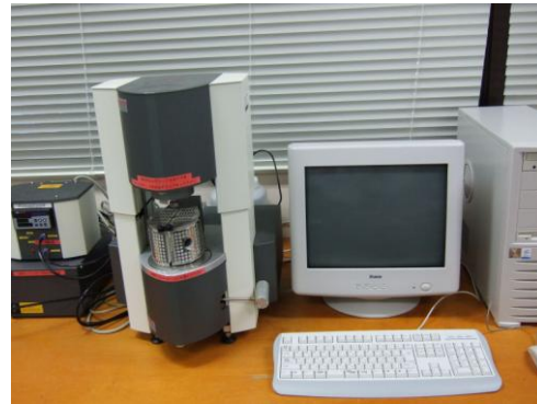
図2 ポリマーレオメータ