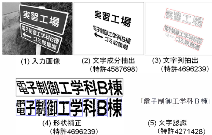
図1 情景中の文字の抽出・認識