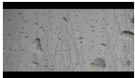
写真 1 複数微細ひび割れ