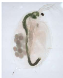
オオミジンコ ( Daphnia magna )