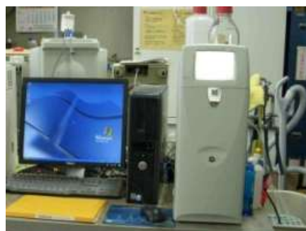
ION CHROMATOGRAPHY ICS-1500