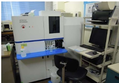
ICP 発光分光分析装置 SPS3500