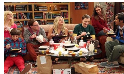
【ことばを使ったやりとり】 ドラマ The Big Bang Theory の1シーン

【コーパスによる表現検索の結果画面】 映画、ドラマ、小説、ニュース、議事録、実会話…考えるヒントや証拠となるデータは、いたるところに溢れています