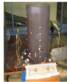
電導性利用浸透実験

また、2つめの研究ミッションとして、小流域の植生や地複状態を反映した流出予測モデルの開発を行っています。小さな集水域でのきめの細かな(流域の地政学的、水文学的变化に対応した)いわば、オーダーメイドの流出モデルを作成いたします。