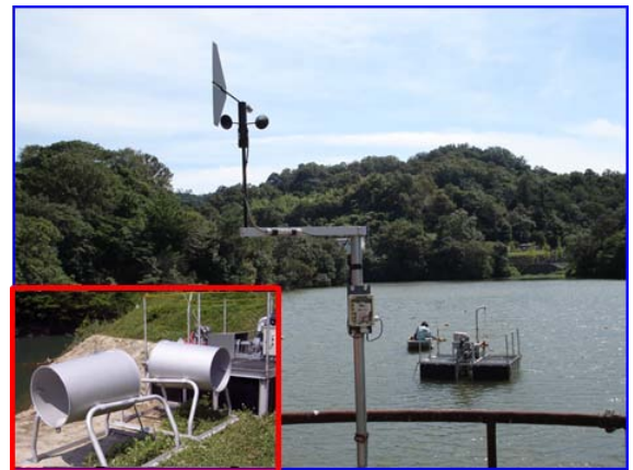
貯水池への水質改善装置の導入と観測