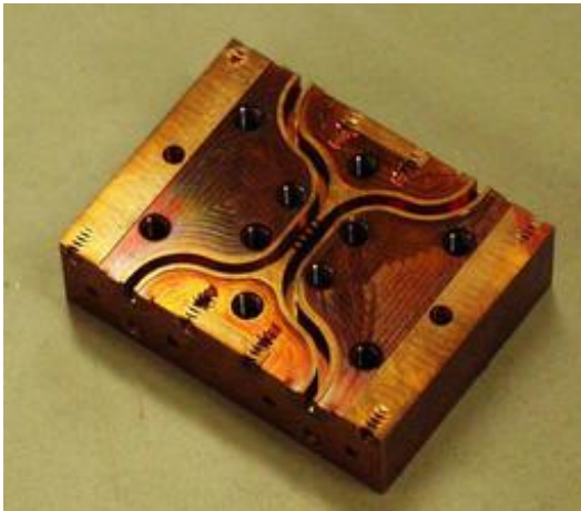
写真 1. 100GHz 帯ブランチラインカプラ