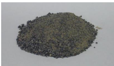
写真1 ごみ溶融スラグ

豊田市では2007年から渡刈クリーンセンターが稼働しているが、このクリーンセンターで製造されている溶融スラグを有効利用する場合のデータがないことから、筆者らは数年前から基礎的研究を行っている。研究では、コンクリートの水セメント比および溶融スラグの混入量を変化させて種々の試験を行うとともに、溶融スラグの骨材強度を評価する方法がなかったため、BS812を応用した破碎試験を実施し、他のクリーンセンターで製造されたごみ溶融スラグと比較を行った。実験結果から、本研究で用いた配合ではスラグ置換率が高くなるに従ってプリーディング率が高くなるが置換率が50%であっても4.2%未満であること、スラグ置換率が50%までについては大きな圧縮強度の低下を生じないこと、細骨材のスラグ置換率が50%までならば凍結融解に対して高い抵抗性を有していること、等の知見を得ている。