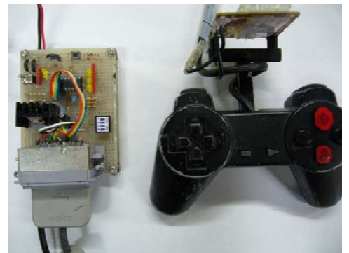
写真1 赤外線ロボット・コントローラ

本研究室では、外乱に強い赤外線無線のプロトコルを開発してきた。その技術を利用して、ゲーム機を使用する人たちには使いなれたゲーム用コントローラを用いた写真1のような赤外線通信を利用してワイヤレスでロボットの操縦ができるコントローラを開発した。赤外線通信の送受信信号の処理にはワンチップマイクロコンピュータであるPIC(Peripheral Interface Controller)を使用している。操縦対象のロボットは車輪型移動ロボットであり、ゲーム用コントローラ特有のボタン操作による操縦を行わせることができる。このロボットをイベント等で子どもたちや一般成人に操縦してもらおうと、説明もなしにボタンを押して、ロボットが動く様子を見ることで自らロボットを操縦する方法を理解することができていた。